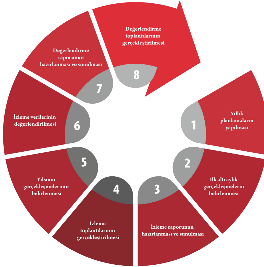
Şekil 2. İzleme Değerlendirme Süreci